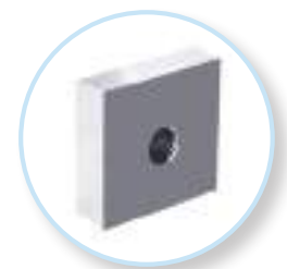
Cuchillas de 8 cortes