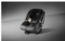
SILLA DE AUTO GRUPO 0