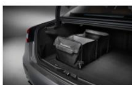
ORGANIZADOR DE MALETERO PLEGABLE