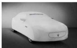
LONA PROTECTORA PARA EL EXTERIOR