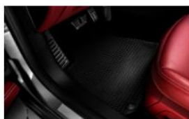
ALFOMBRILLAS DE INVIERNO CIZQ BIZONA