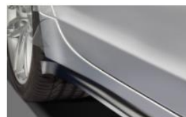
PELÍCULAS LATERALES TRASERAS LADO IZDO.