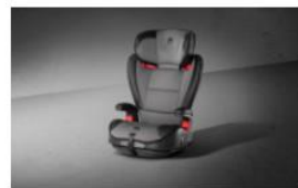
SILLA DE AUTO GR.2/3