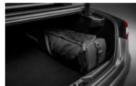
BOLSA PORTA ESQUÍS Y SNOWBOARD