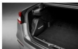
KIT DE EMERGENCIA