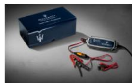
CONSERVADOR DE CARGA