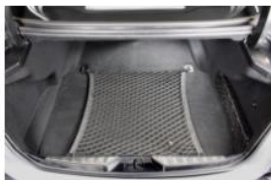
RED SEPARADORA DE EQUIPAJE MALETERO