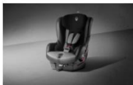
SILLA DE AUTO GR.1