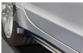
PELÍCULAS LATERALES TRASERAS LADO DCHO.