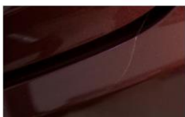
PELÍCULA DE PROTECCIÓN PARA BORDE DE CARGA