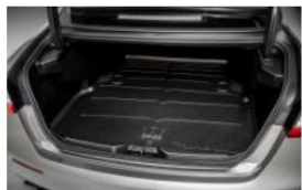
ALFOMBRILLA PARA EL MALETERO