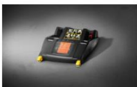
BASE ISOFIX GRUPO 0