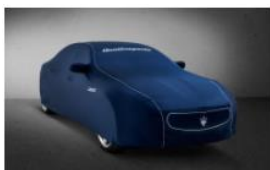
LONA PROTECTORA PARA EL INTERIOR