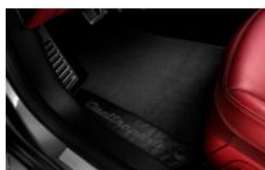
ALFOMBRILLAS CON LOGOTIPO - CIZQ