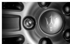
KIT DE ESPÁRRAGOS ANTIRROBO