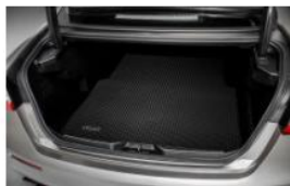
ALFOMBRILLA DE MALETERO REVERSIBLE