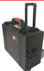
Maleta de plástico para cables con ruedas