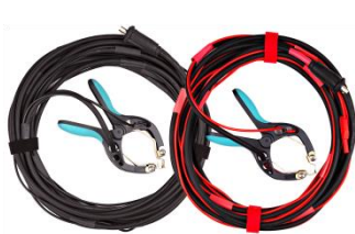
Cables de corriente y tensión con pinzas TTA