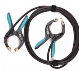
Cable de conexión de corriente con pinzas TTA