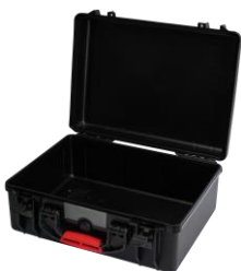
Maleta de plástico para cables