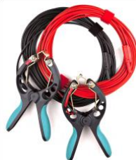
Cables de tensión con pinzas TTA