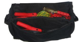
Bolsa para cables