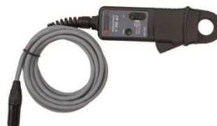
Pinza de corriente 30/300 A con extensión de 5 m